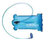
Drinkbag Art. 41941 29,90 CHF