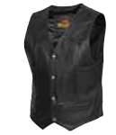
Dillon Art. 5271 169,00 CHF