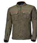
Bailey Art. 61913 318,00 CHF