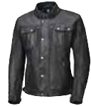
Starien Art. 52222 469,00 CHF