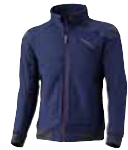
San Remo Art. 6607 218,00 CHF