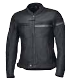
Midway Art. 52321 549,00 CHF