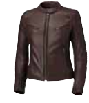
Robin Art. 52522 398,00 CHF