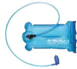
Drinkbag Art. 41941 29,90 CHF