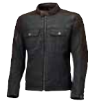
Jester 2 Art. 62514 448,00 CHF