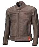
Hot Rock Art. 51934 569,00 CHF