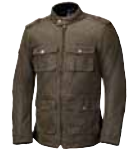
Lawrence Art. 62210 369,00 CHF