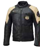
Baker 2 Art. 52521 448,00 CHF