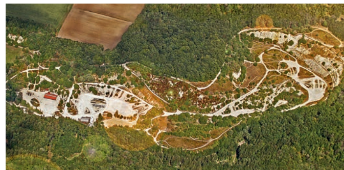
26 Hektar kompromissloser Fahrspaß.

Mit staubigen Grüßen dein Team vom Enduro Park Hechlingen