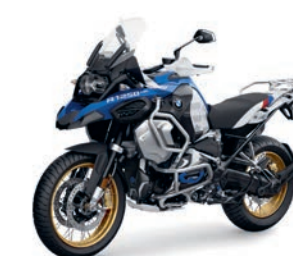
R 1250 GS Adventure

Zudem bieten wir für Anfänger auch leistungsreduzierte Modelle. Alle Motorräder, außer die BMW F 850 GS Adventure und die BMW G 310 GS, stehen auch als tiefergelegte Versionen zur Verfügung. Oder du kommst direkt mit deinem eigenen Motorrad und lernst, es noch besser zu beherrschen. (Die Voraussetzungen für ein Training mit dem eigenen Motorrad findest du auf der nächsten Seite.)