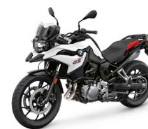
F 750 GS