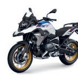
R 1250 GS