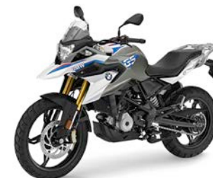
G 310 GS

Adrenalin-Kick. Nicht nur das große Gelände mit seinen verschiedenen Übungssektionen, auch die modernen Gebäude mit komfortablen Bewirtungs- und Umkleideräumen lassen keine Wünsche offen. Freu dich schon jetzt auf unsere exzellenten Kurse und unsere Maschinen. Folgende Modelle von BMW Motorrad kommen bei uns zum Einsatz: