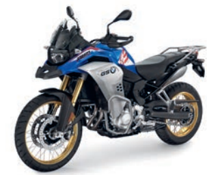
F 850 GS Adventure