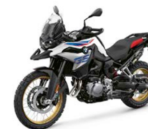
F 850 GS