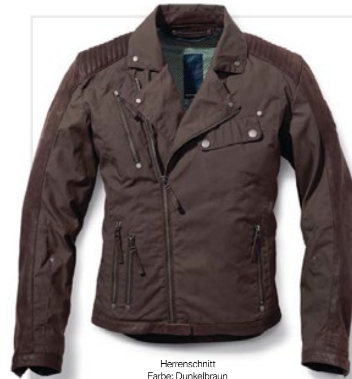
Herrenschnitt Farbe: Dunkelbraun