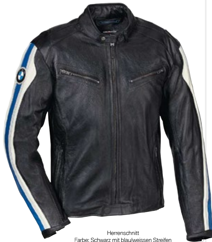
Herrenschnitt Farbe: Schwarz mit blau/weißen Streifen