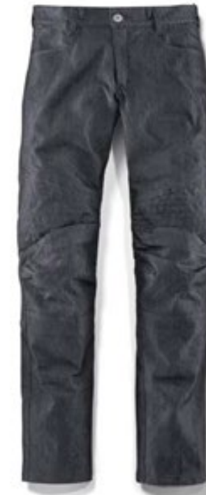
Damenschnitt Farbe: Grau