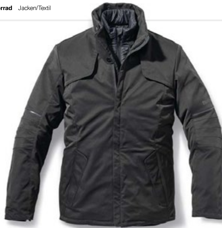
Herrenschnitt Farbe: Aussenjacke Anthrazit, Innenjacke Schwarz