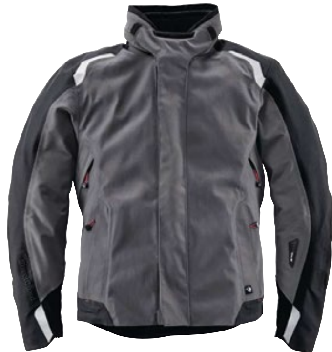
Herrenschnitt Farbe: Anthrazit