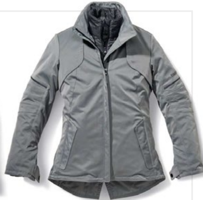
Damenschnitt Farbe: Aussenjacke Grau, Innenjacke Schwarz