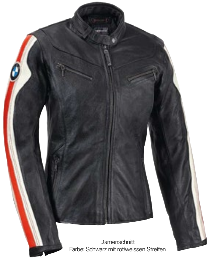
Damenschnitt Farbe: Schwarz mit rot/weißen Streifen