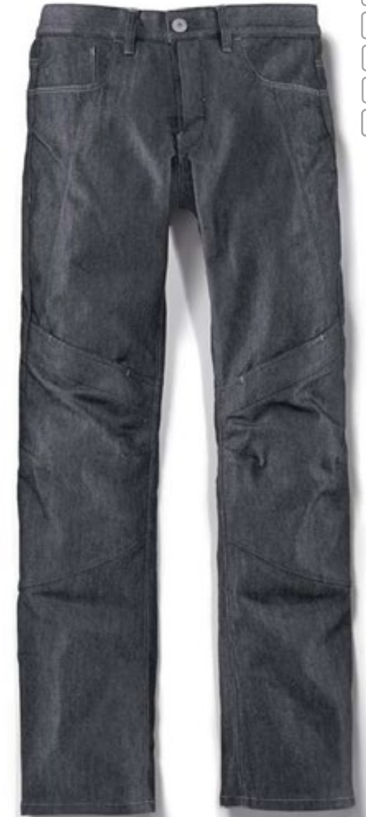
Herrenschnitt Farbe: Grau